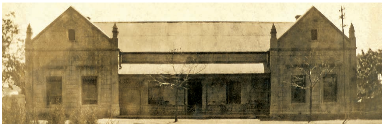
Die Joubert-huis wat as inspirasie vir die nuwe ontwerp gedien het.

In 'n poging om AHS se onderrig-fasiliteite te verbeter, beplan die skool om in 2022 met bouwerk aan veertien nuwe klaskamers te begin. Die gebou sal op die oostelike wal van die B- en C-rugbyveld wees en die tydelike klasse, wat tans as die T-lokale bekend staan, vervang.