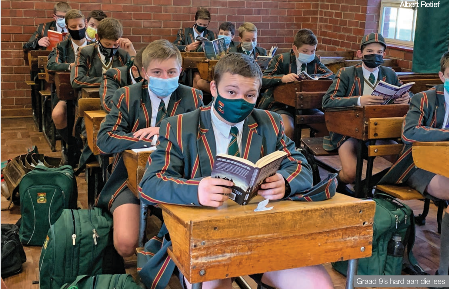
Graad 9's hard aan die lees

'n Nuwe, ongekende stilte hang deesdae elke Maandag en Woensdag tydens voogperiode oor die skool. Affies van graad 8 tot 12 sit vir 20 minute soos wafferse boekwurms met boeke en tydskrifte en verbeter só hul leesvernuif.