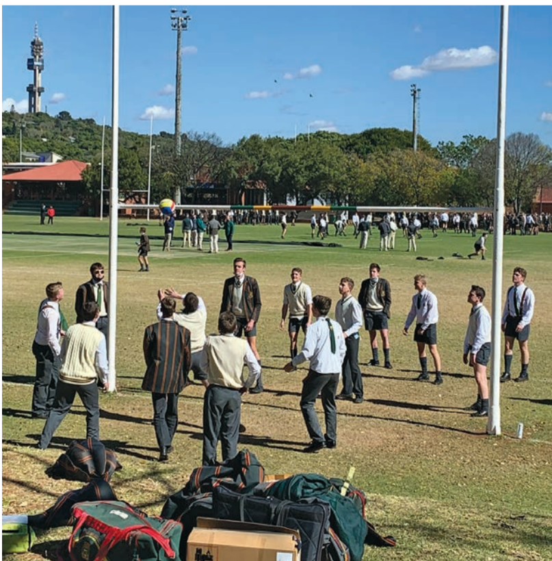
Vlugbal of "volley ball" oor die rugbypale is nou 'n gewilde sportsoort tydens pouses.