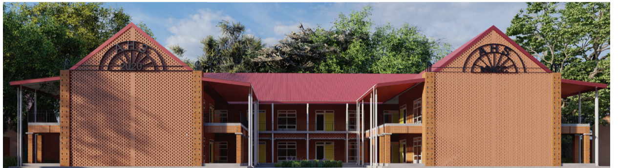
'n Argitekvoorstel van die beplande klaskamers