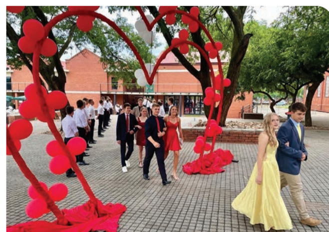
Valentynsbalvreugde! (Bladsy 7)