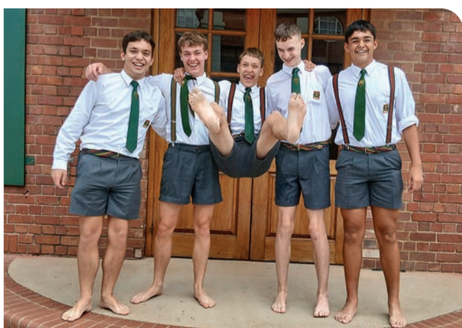
Kaalvoetdag laat die rande inrol. (Bladsy 7)